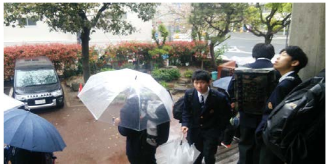
今年は残念ながら雨模様