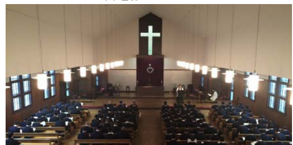
良いお話をありがとうございました