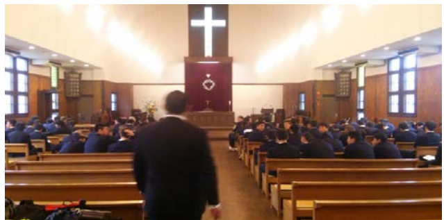
中は大きな礼拝堂