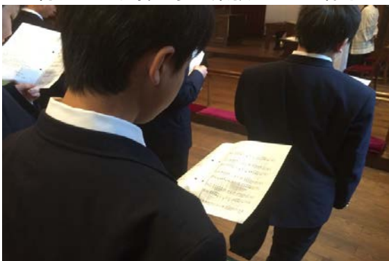
礼拝が始まります