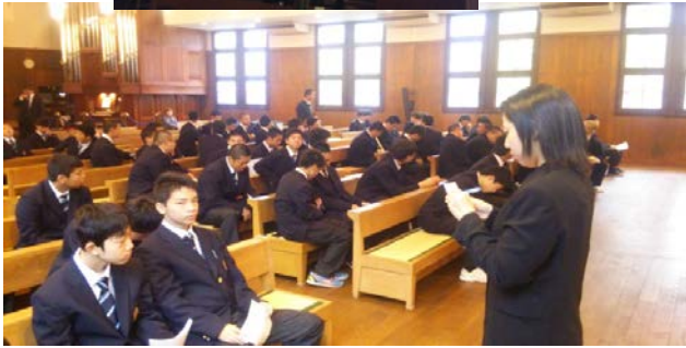
新しい先生に名前を呼んでもらい