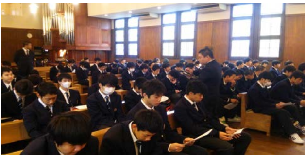
初めての礼拝で少し緊張している様子