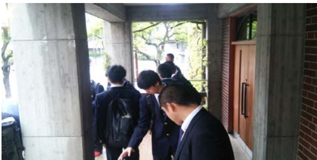
開場までしばらく待ちます