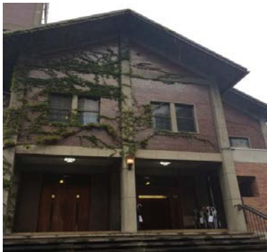
神戸 聖ミカエル教会