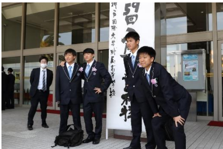
こうべ・こくさい