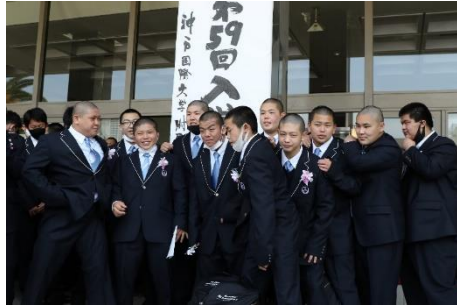
き な み