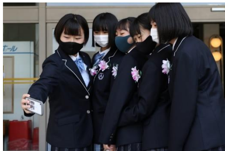
セント・マイケルズ