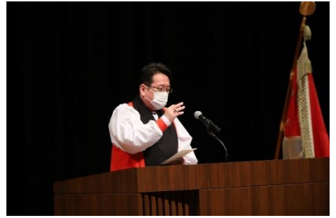
St. Michael's High School